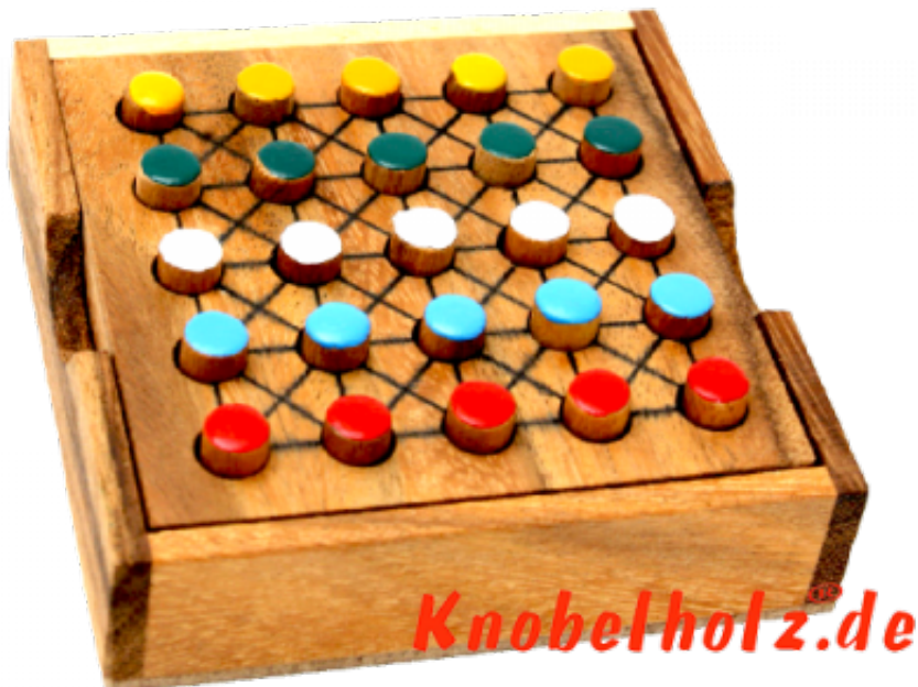
Sudoku Colour Box 5x5 mit 5 Farben in 5 Zahlenreihen schaffst Du es das jede Farbe in jeder Reihe nur einmal vorkommt? ???????