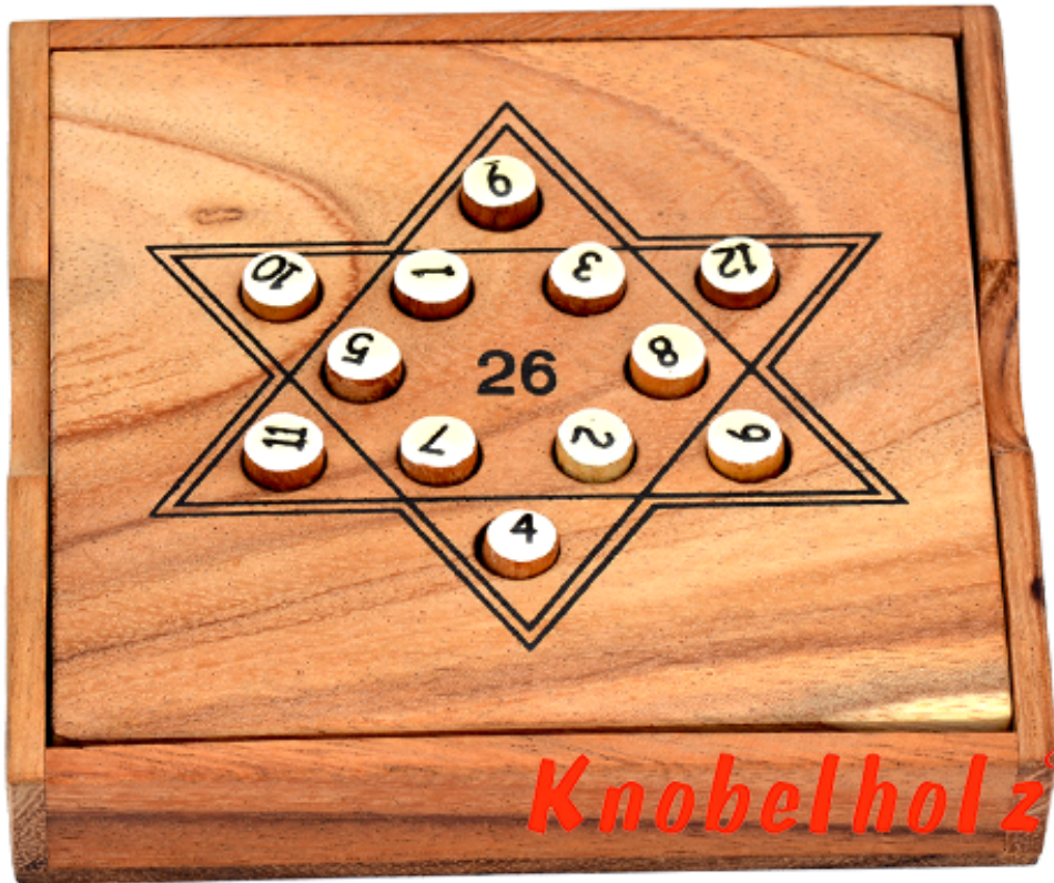
Star 26 Zahlenspiel Strategiespiel mit rechnen die Holzvariante in den Maßen 12,8 x 12,8 x 3,0 cm, star 26 mathe samanea wooden game