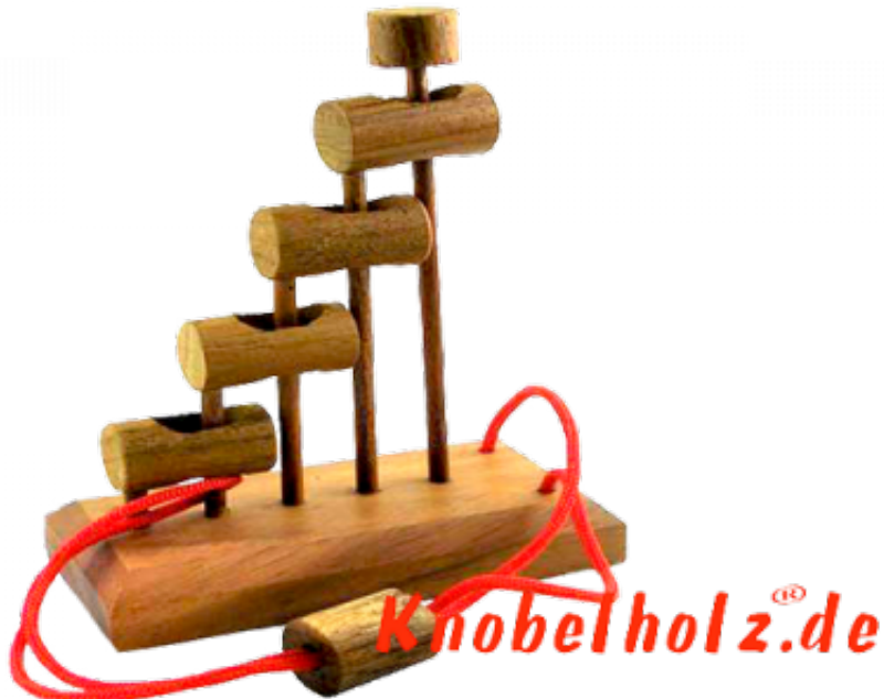
4 Ringe Steps Puzzle und eine Schnur ein anderes Design aber selbe Aufgabe... führe die Schnur aus den 4 Ringen.... ??????????