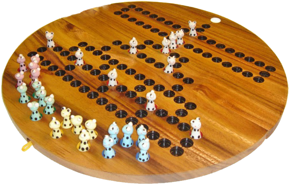
Barrikade Frog, Blockade Würfelspiel aus Samanea Holz mit den Maßen 39,0 x 39,0 x 3,5 cm , barricade wooden game board round monkey pod